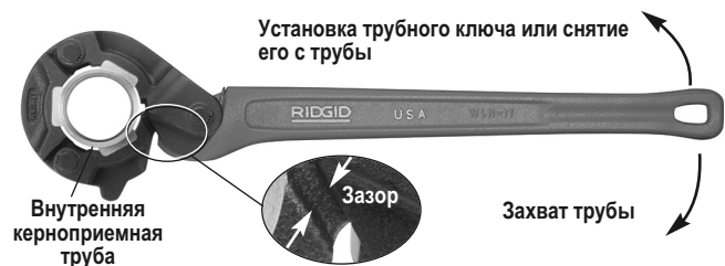
Рис. 2 – Работа с колоночным трубным ключом

http://www.ridgid-piter.com +7 (921) 936-02-07 +7 (812) 331-37-51